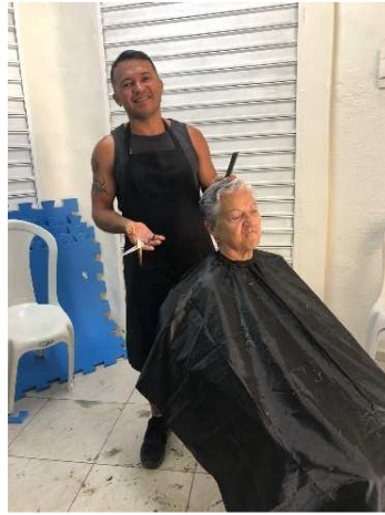
Oficina de Corte de cabelo /Cras Região Oceânica, Bosque fundo, Santa Paula